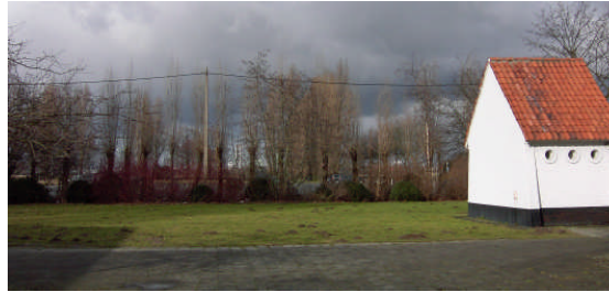
het bouwterrein voor het lokaal, links naast de kapel

Het terrein is eigendom van de NV Waterwegen en Zeekanaal en werd met notariële akte van 16.12.2008 voor 75 jaar in erfpacht gegeven aan de Kerkfabriek Sint-Anna-ten-Drieën.